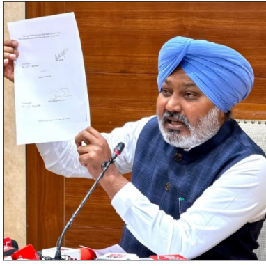
Harpal Singh Cheema termed the move a decisive step to up-

CHANDIGARH: The Punjab government, led by Chief Minister Bhagwant Mann, has officially implemented the 'Sri Guru Granth Sahib Satkar Amendment Bill' after receiving assent from the Governor. The legislation mandates life imprisonment for those found guilty of desecration of Sri Guru Granth Sahib. Addressing a press conference at Punjab Bhawan, Cabinet Minister